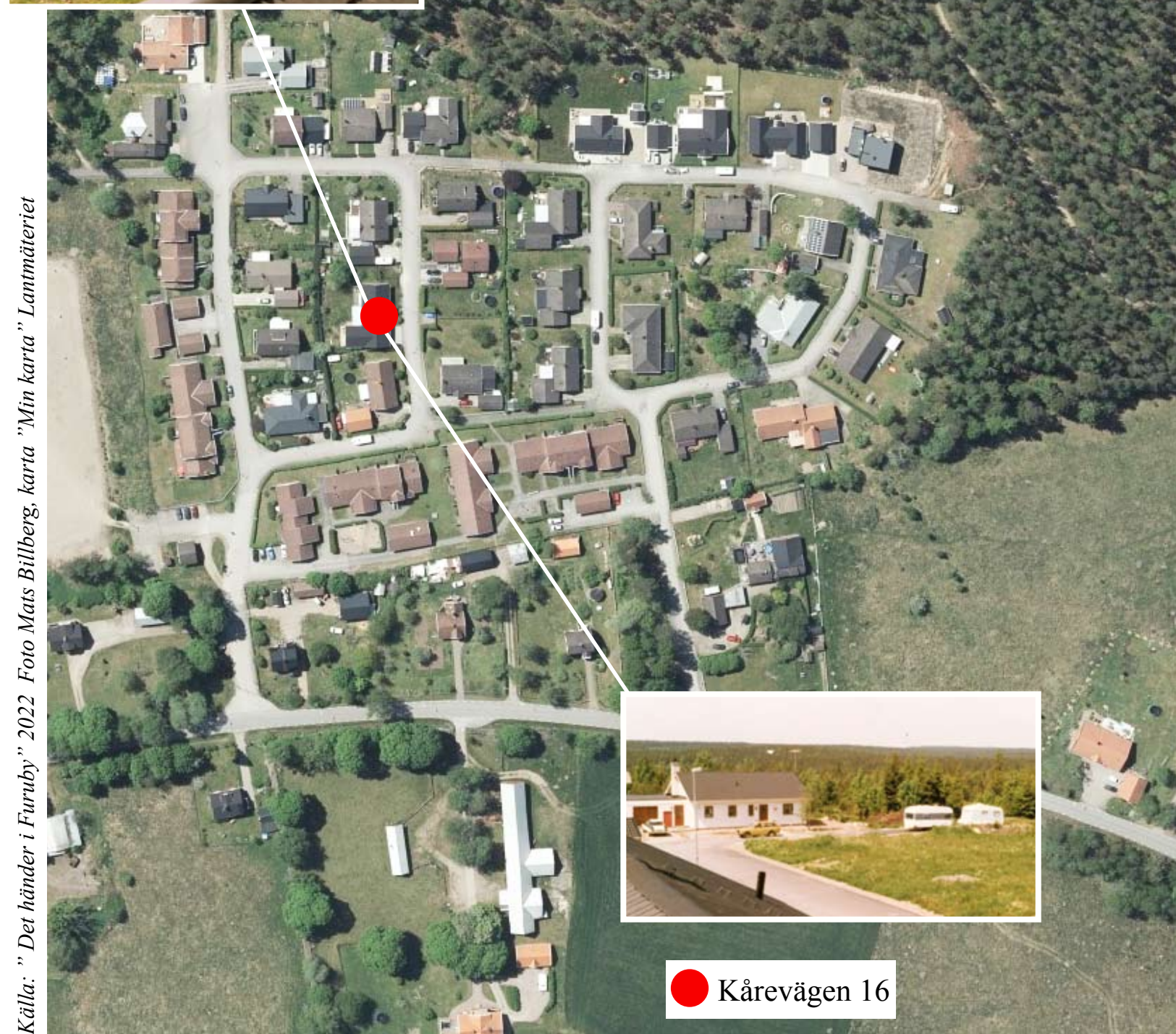
Källa: "Det händer i Furuby" 2022 Foto Mats Billberg, karta "Min karta" Lantmäteriet

40 % i Furuby inklusive gårdar 1/3 har gatuadress 60 % bor utanför Furuby tätort