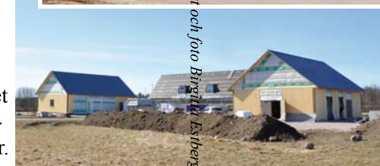
Text och foto Birgitta Esberg